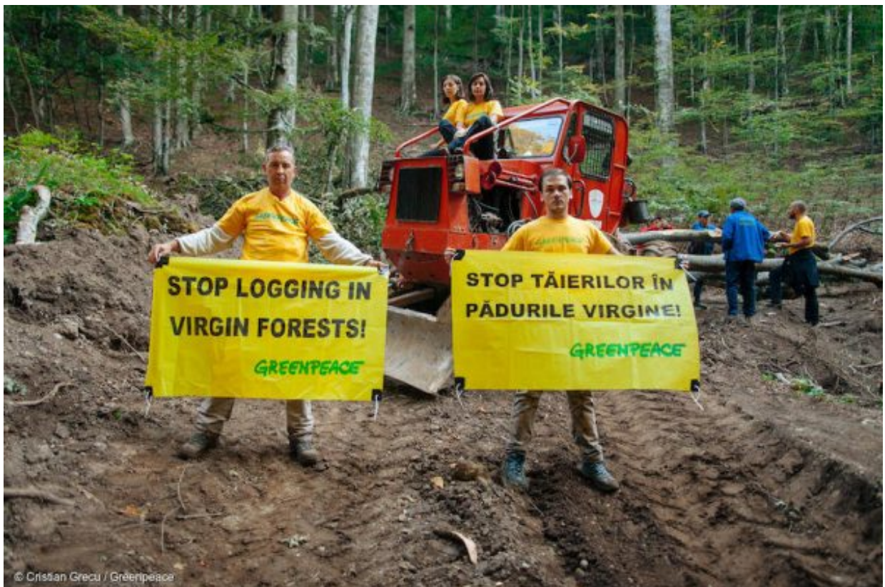
Romania: proteste di Greenpeace contro la mafia del legno.